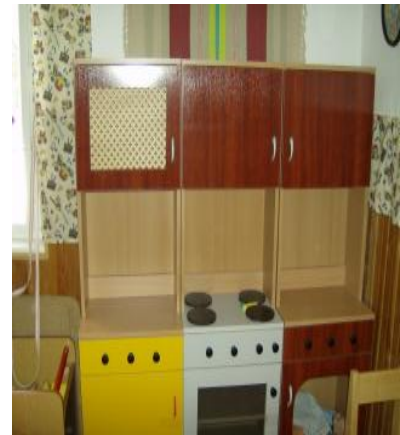
Pillangó csoport új konyhabútora

Óvodánk Szülő Szervezetének köszönhetően az előző évhez hasonlóan decemberben is bebútoroztunk egy csoportot: ilyen fejlesztéssel kevés óvoda büszkélkedhet – még egyszer, köszönet érte.