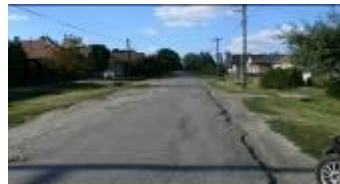
Dózsa Gy. u. és annak külső szakasza felújítás előtt

A szennyvíz beruházási pályázatunkkal kapcsolatban sincs végleges döntés, szintén nincs még eredmény az általános iskola informatikai pályázatára. Egyedül a Dózsa Gy. utcai járda és közút felújítása készült el mintegy 13.650.000 Ft értékben.