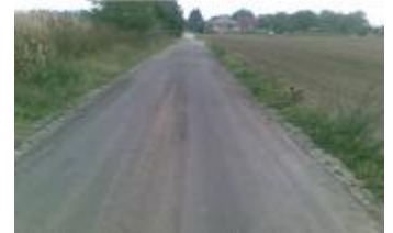
Ady E. u. felújítás előtt és után

Kipróbáltunk egy új technológiát, mellyel a földutakat lehet elfogadható áron (610-630 Ft/fm) évekre használhatóvá tenni.